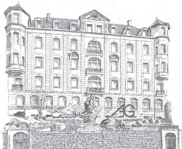
Das Domizil unserer Trauringmanufaktur August Gerstner, erbaut 1902.

achten Sie auf dieses Siegel in Ihrem T kat